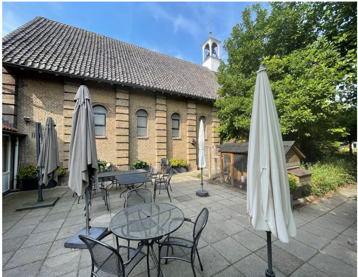
Terras en kapel