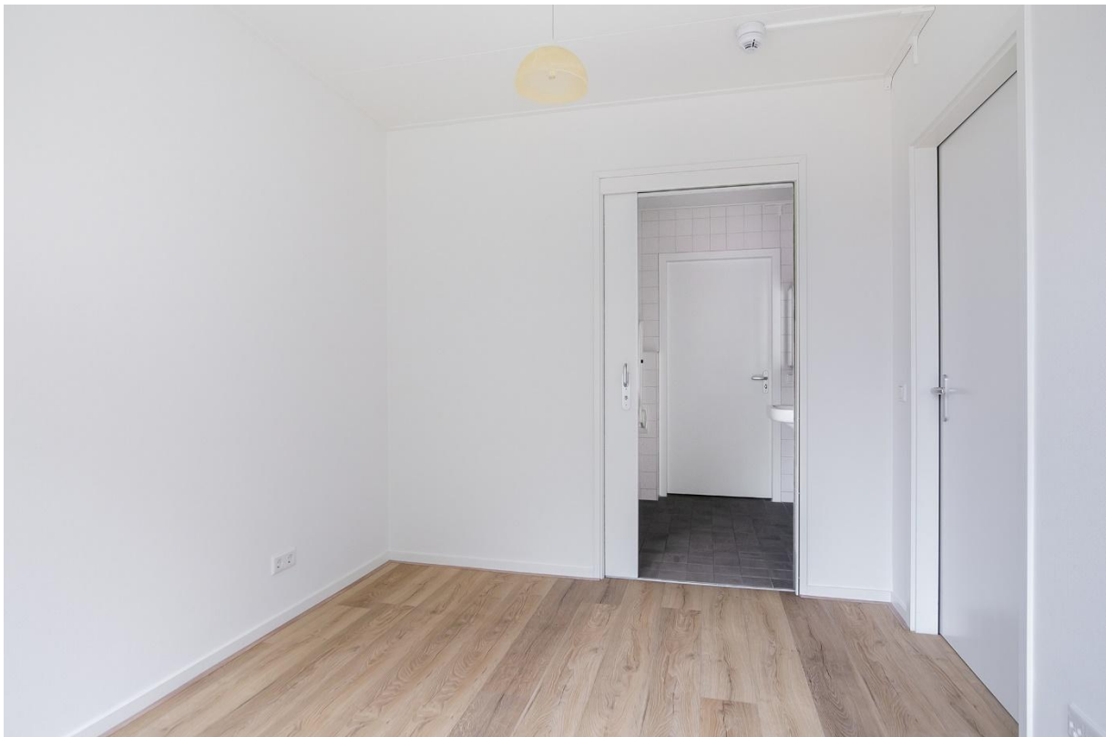
Slaapkamer met deur nar badkamer