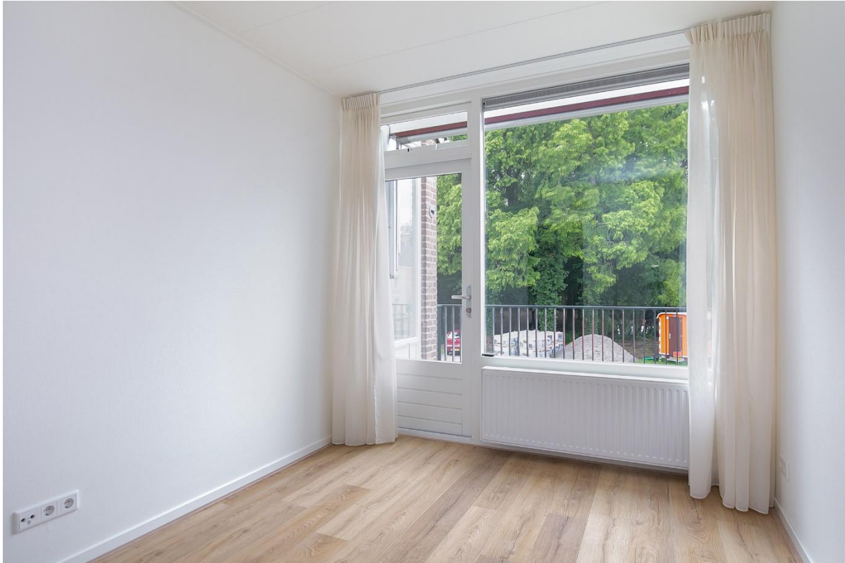
Slaapkamer met deur naar balkon