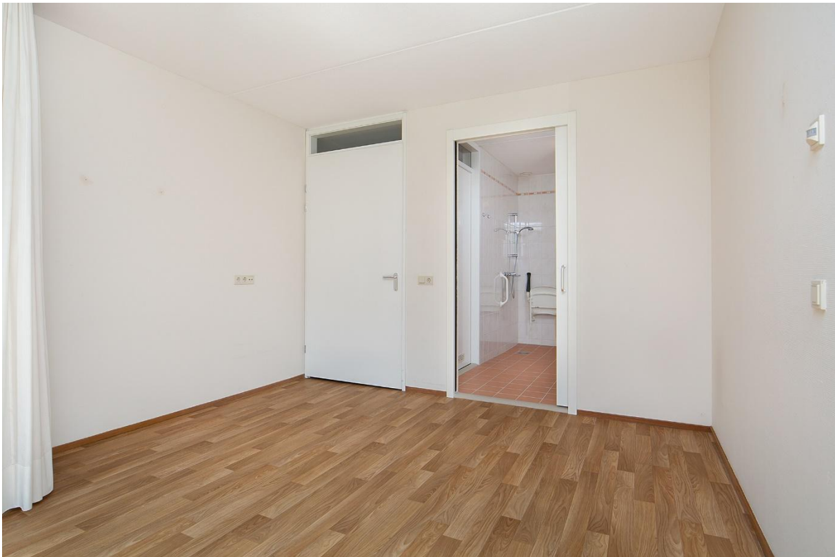
Slaapkamer met deur naar badkamer